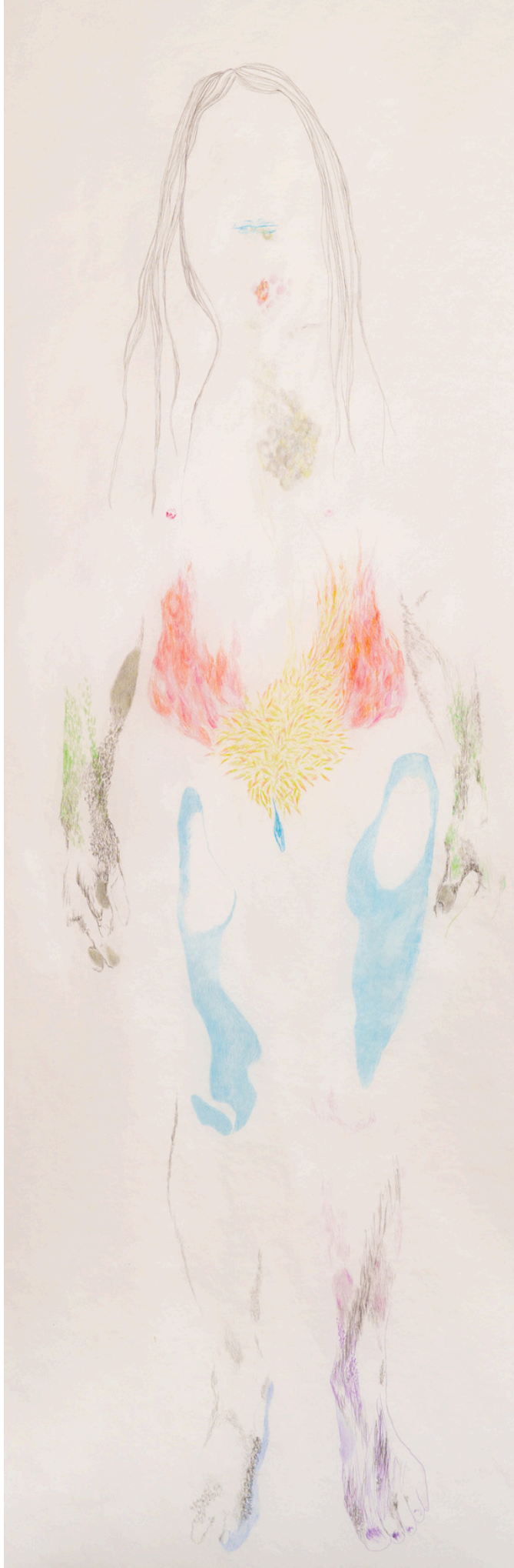
Détails de Lénaïc 1, Lise 2, Thom 1