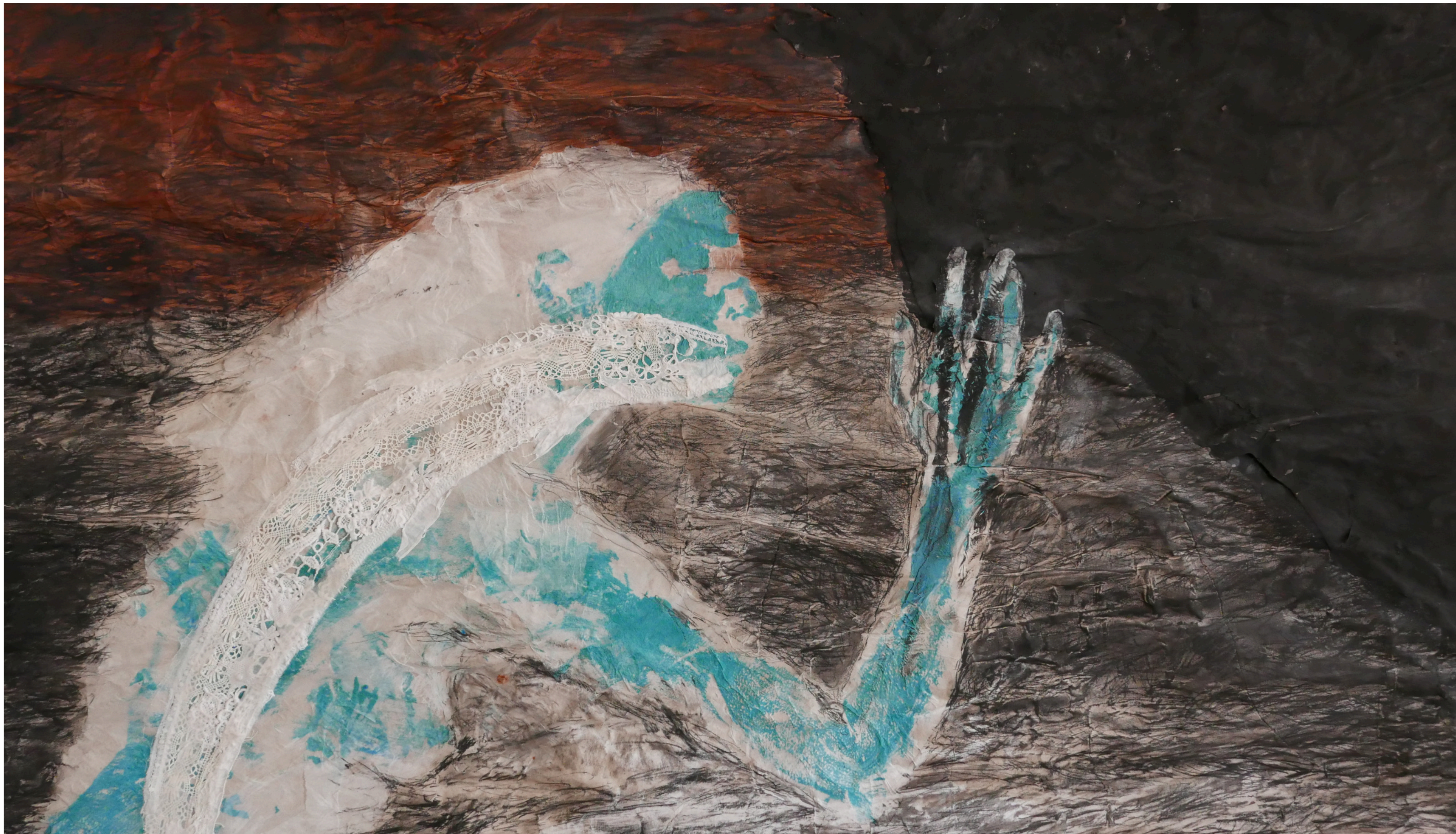
Un Sueño, 2020