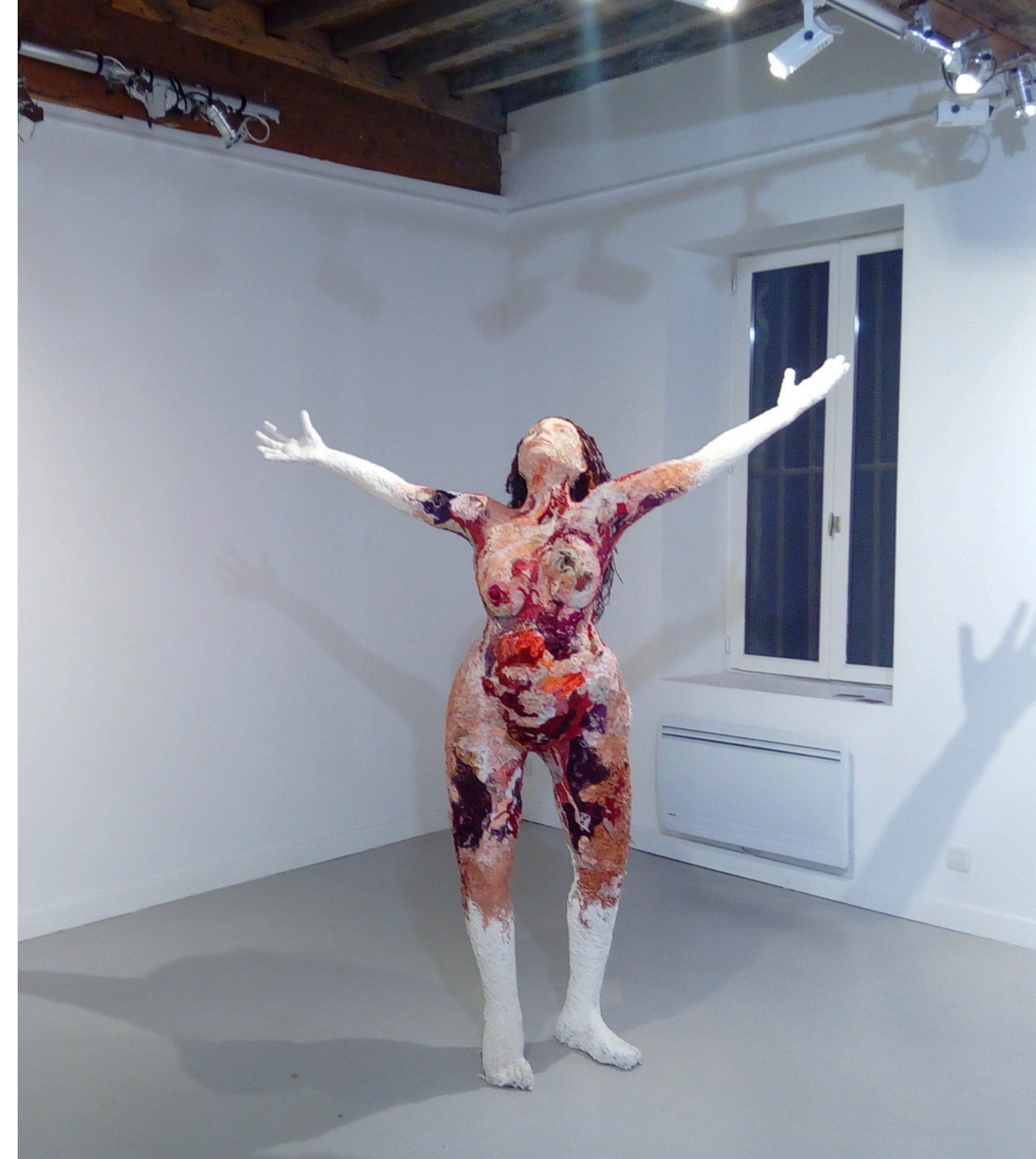
Vue d'exposition, Galerie Test du Bailler, Vienne, 2016

anthropomorphique je rends hommage à la réalité organique du corps des femmes, mise en perspective avec ses aspects mythologiques et archétypaux.