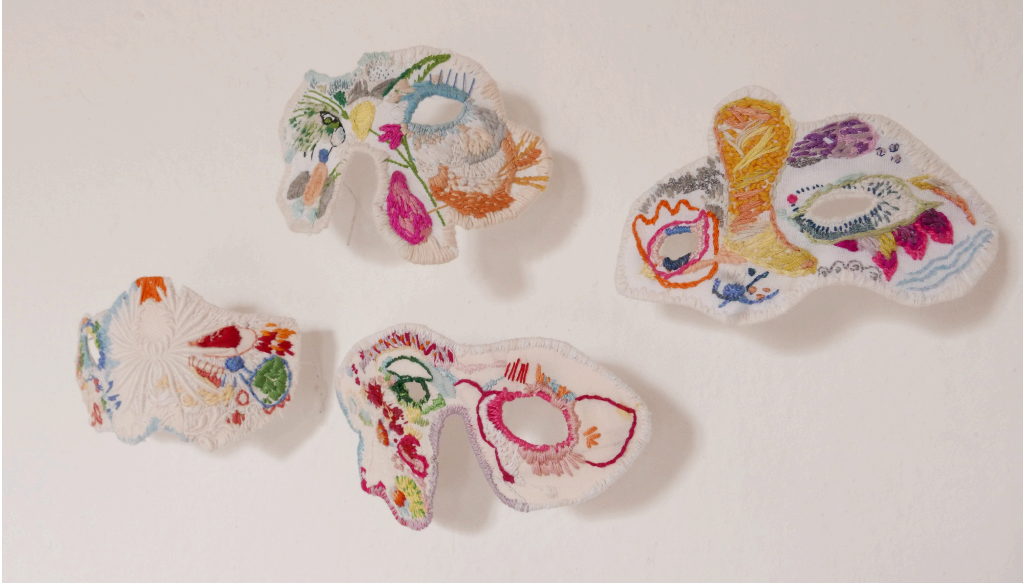
Vous n'allez quand même pas, 2025