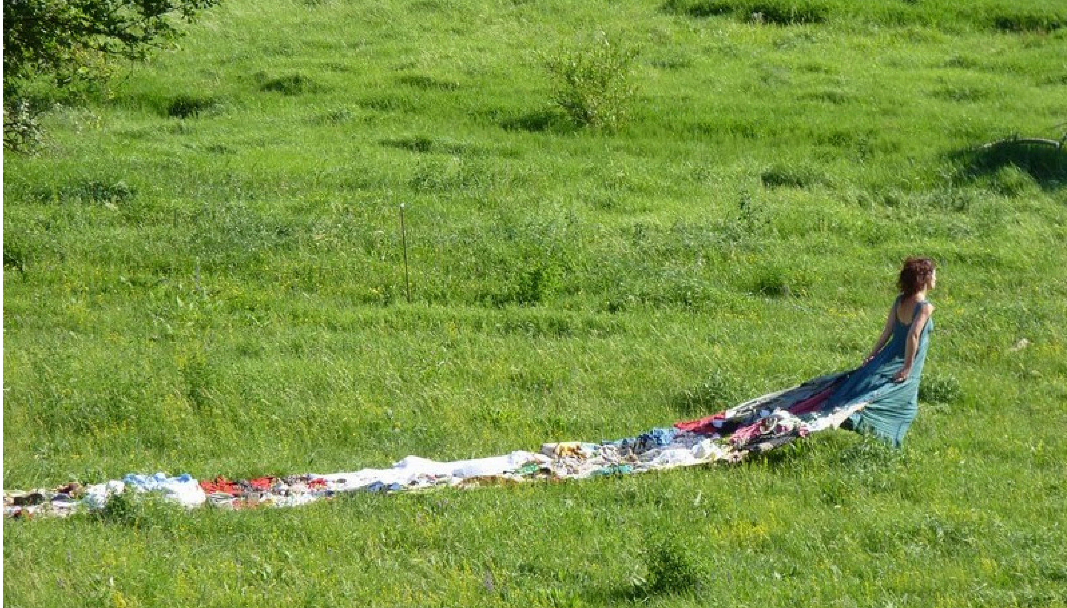
Charrier-rivière, 2018 Etape de la traversée à Montmaur